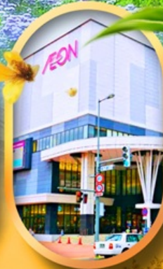
อ็อนมอลล์