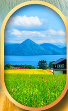
ทะเลสาบโทโยะ