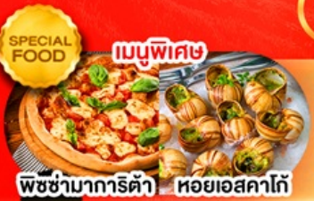
พิซซ่ามาการิตต้า หอยยอสดาคั่ว