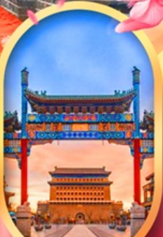
ถนนคนเดินเทียนเหมิน ผ่านชมสนามกีฬาฟางรังนก