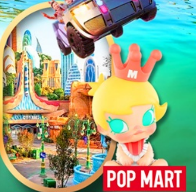
เลือกซื้อทัวร์เสริม เซี่ยงไฮ้ ดิสนีย์แลนด์