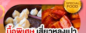
มือพิเศษ เสี่ยวหลงเปา หมูตงพอ ซิโครงหมู เดินทาง ม.ค. - มี.ค. 69