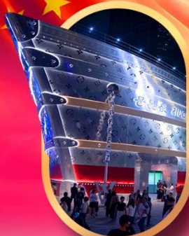
เรืออะทลุลย์