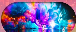
หมู่บ้านเมียนฮัววาน ชมแสงสียามค่ำคืน

เชียงใหม่ ทางโจว ล่องเรือทะเลสาบซีหู อุ๊ซี