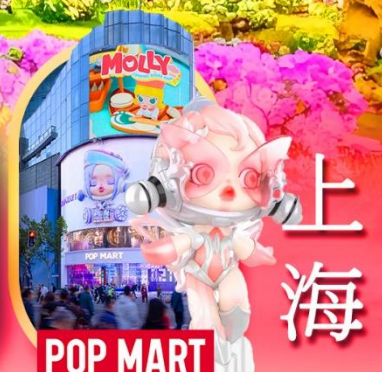
ช้อปปิ้งถนนหนางจิง