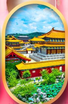
เมืองจำลองสามก๊ก