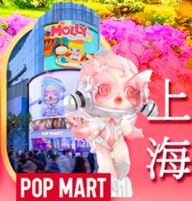
ช้อปปิ้งถนนหนางจิง