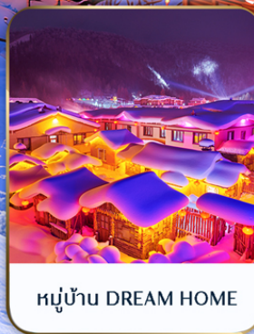
หมู่บ้าน DREAM HOME