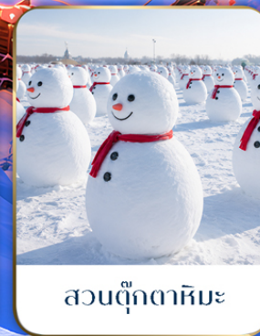
สวนตุ๊กตาหิมะ