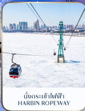
นั่งกระเช้าไฟฟ้า HARBIN ROPEWAY