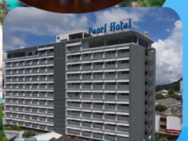
โรงแรมเพิร์ล