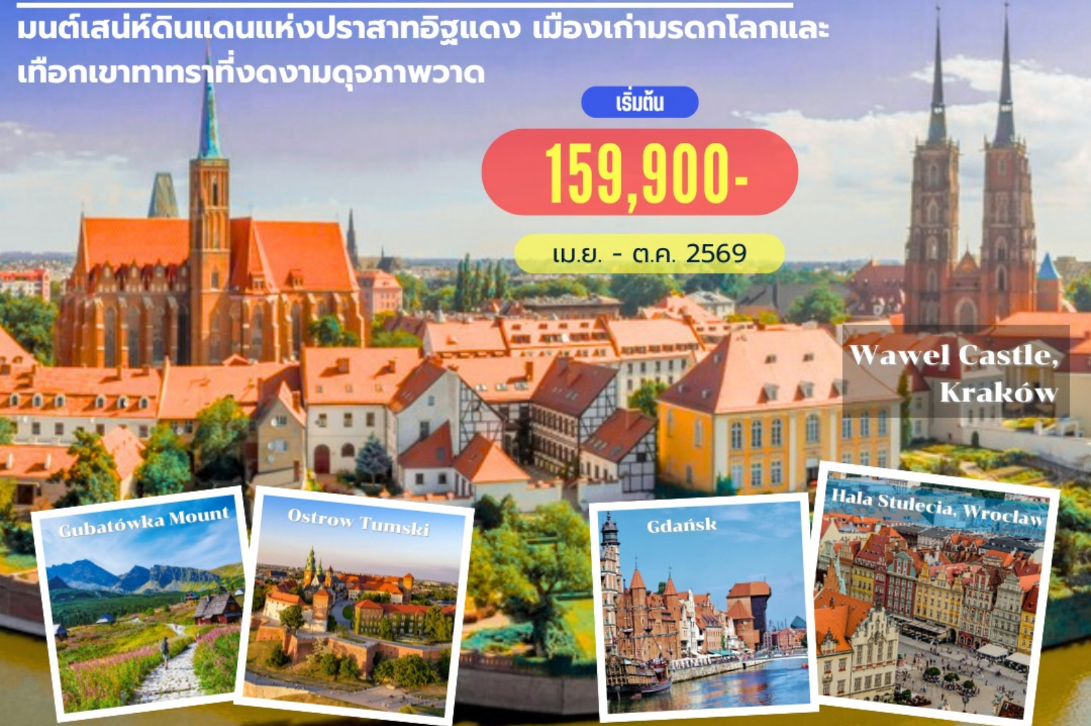
Wawel Castle, Kraków