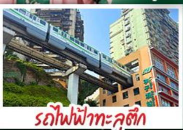
รถไฟฟ้าทะเลอู๋ตัก

2UCKG-FD014 | 6 วัน 4 คืน | AirAsia | โรงแรม 4 ดาว