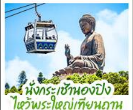
นั่งกระเช้าเองปีง ใจวัดพระใหญ่เทียนถาน