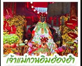
เจ้าแม่ทวนอิมฮ่องฮ่า