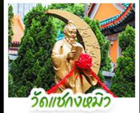
วัดเซกทงหมิว