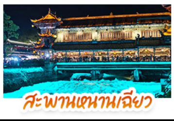
สะพานเจ้านานเฉียว