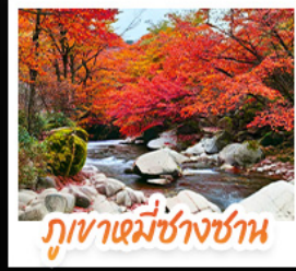
ภูเขาแม่ช้างซาน