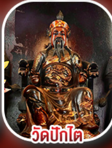
วัดบิกิตไต้