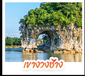
เวางวงช้าง