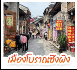
เมืองโบราณเซิงผิง

เช็คอินจุดไฮไลท์ใกล้ทัยหลิน เจดีย์เงินเจดีย์ทอง เวางวงช้าง นั่งเคเบิลคาร์สู่ เนาหรือ จุดชมวิวกะหลกเา แห่งเมืองหยางชั๋ว ล่องเรือแม่น้ำลู่เจียง ตามรอยช้างหลังกาพรนบัตร 20 หยวน อิสระ ช้อปปิ้งถนนคนเดิน 2 แห่ง ถนนตงซีเซียง ถนนซีเซียง นั่งกระเช้าบอลูนชมวิวแบบ 360 องศา