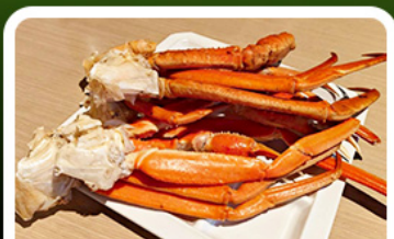
เมนูพิเศษ! ขาปู