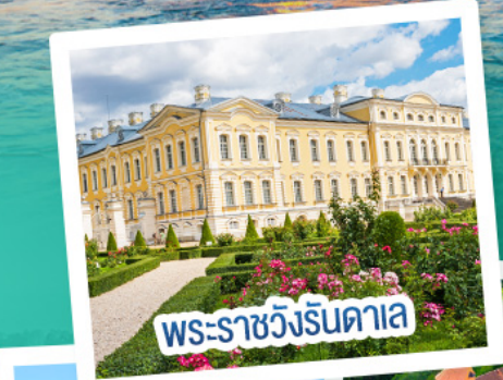
พระราชวังรินดาอาล