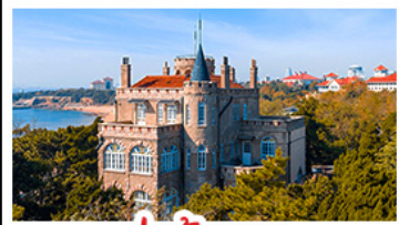
ป่าตึกวน

พระราชวังฤดูร้อน - วิวเมืองซิงเต่า รถไฟความเร็วสูง - ภูเขาเหลาซาน กำแพงเมืองจีนด่านจวิยงกวน - ป่าตึกวน พักโรงแรมระดับ 4 ดาว - ไม่หลงร้านช้อปปิ้ง มือพิเศษ เปิดปักกิ่ง , หม้อไฟซีฟู้ด