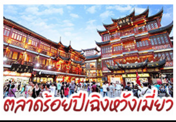
ตลาดร้อยปีฉิงหวังเหมียว