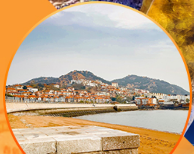
ซาจื่อโป่ว