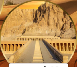
หุบเขากษัตริย์