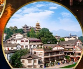
เมืองโบราณฉือโจ้ว