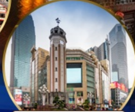
ถนนคนเดินเจียวฝางเป่ย์