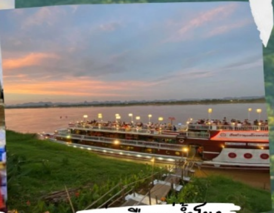
ล่องเรือแม่น้ำโขง