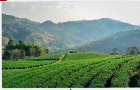
ดอยแม่สลอง