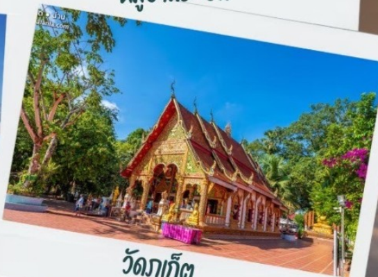
วัดภูเก็ต