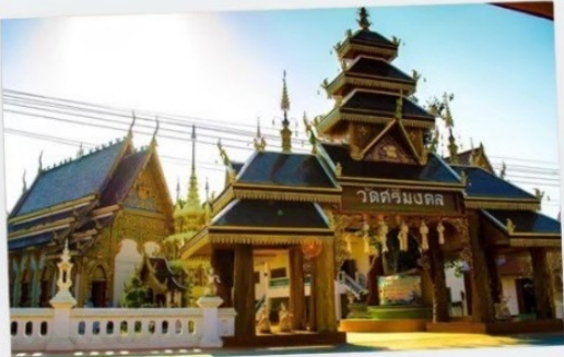
วัดศรีมงคล (วัดก่าง)