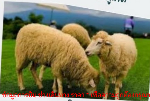
ฟาร์มแกะ