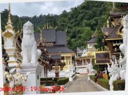
วัดป่าเซตวัน