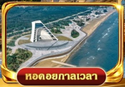
หอคอยกาลเวลา