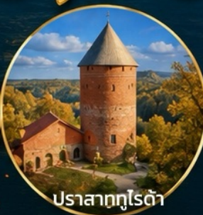
ปราสาทกูโรต้า