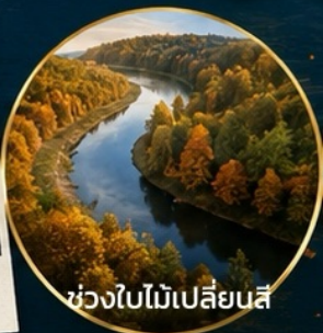
ช่วงใบไม้เปลี่ยนสี