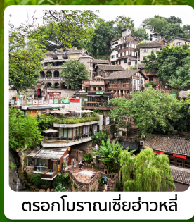
ตรอกโบราณเซี่ยฮ่าวหลี่