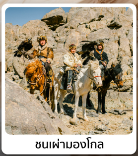
ชนเผ่ามองโกล