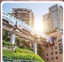
รถไฟฟ้าทะลุฟ้า

ไฮไลท์อุทยานแห่งชาติหลุมฟ้า 3 สะพานสวรรค์มรดกโลกระดับ 5 A ชมไฟยามค่ำคืนของสถาปัตยกรรมจีนโบราณ หงหยาดัง