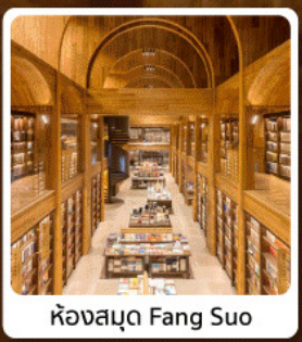
ห้องสมุด Fang Suo