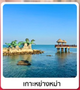
เกาะหย่างหม่า