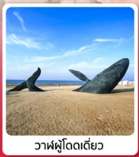
วาฬผู้โดดเดี่ยว