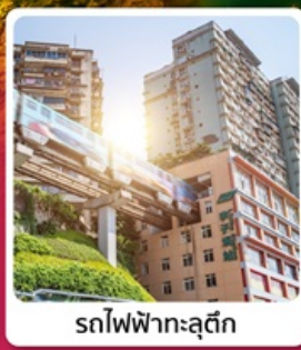
รถไฟฟ้ากระตุ๊ก