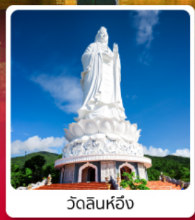
วัดลินหวิง