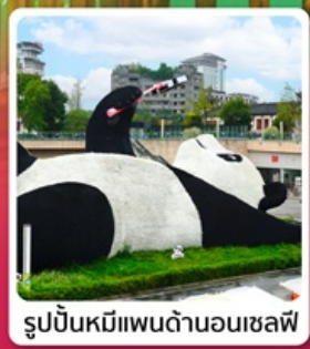
รูปปั้นหมีแพนด้าอนุเชลฟ์