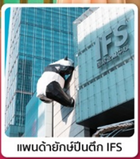
แพนด้ายักษ์ปิ่นตึก IFS

● ไอล็อก อุทยานแห่งชาติปี้เฟิงโกว สวิตเซอร์แลนด์น้อยแห่งเสฉวนตะวันตก Chengdu SKP จุดถ่ายรูปรูปยอตฮิตและทำคอนเทนต์ของวัยรุ่นเจิงตู