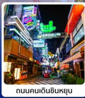
ถนนคนเดินซินหยุน