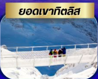
ยอดเขากิตลิส