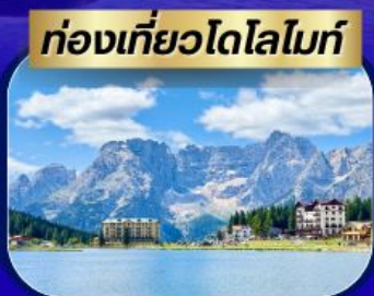
ท่องเที่ยวโดโลไมท์