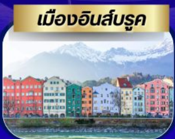
เมืองอินส์บรุค