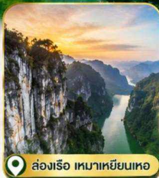
📍 ล่องเรือ เหมาเหยียนเหอ