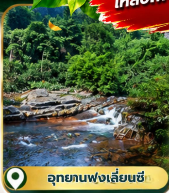
อุทยานฟ่งเลี่ยนซี