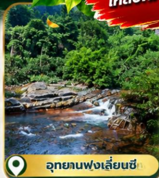
📍 อุทยานฟงเลี่ยนซี