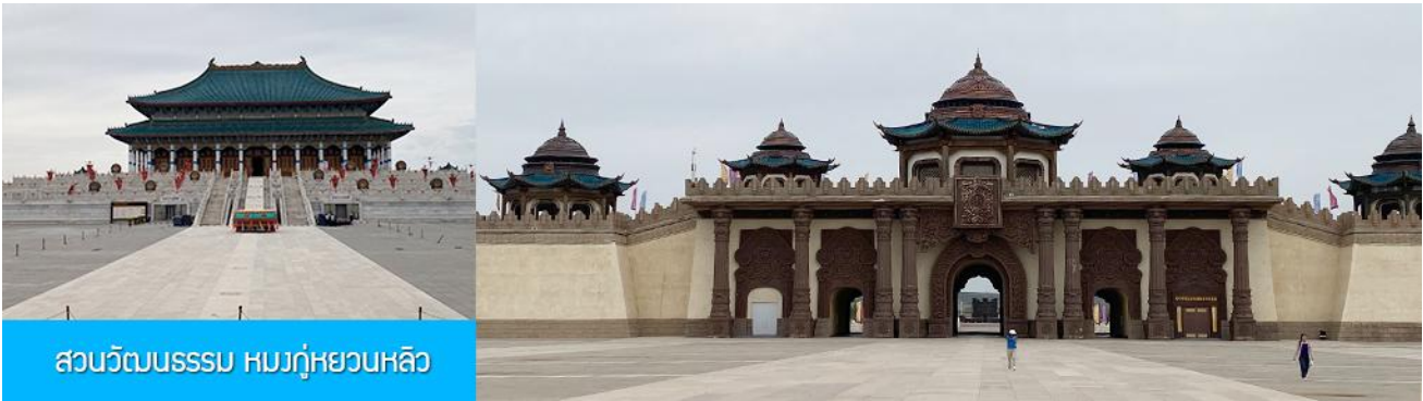
สวนวัฒนธรรม หมงกู่หยวนหลิว

หลังอาหารนำท่าน เที่ยวชม จวนอ๋องจวินหวัง 郡王府 จวนแห่งนี้เริ่มสร้างขึ้นในปี ค.ศ. 1902 สร้างเสร็จในปี ค.ศ. 1936 เป็นที่พำนักของ อ๋องอิฉีจวินหวัง 伊旗郡王 เป็นจวนอ๋องเพียงหนึ่งเดียวที่ได้รับการอนุรักษ์ในสภาพที่สมบูรณ์ โครงสร้างทำด้วยอิฐ หิน และไม้ ประกอบด้วยห้องพัก 16 ห้อง เป็นสถาปัตยกรรมผสมแบบมองโกล ทิเบต และฮั่น