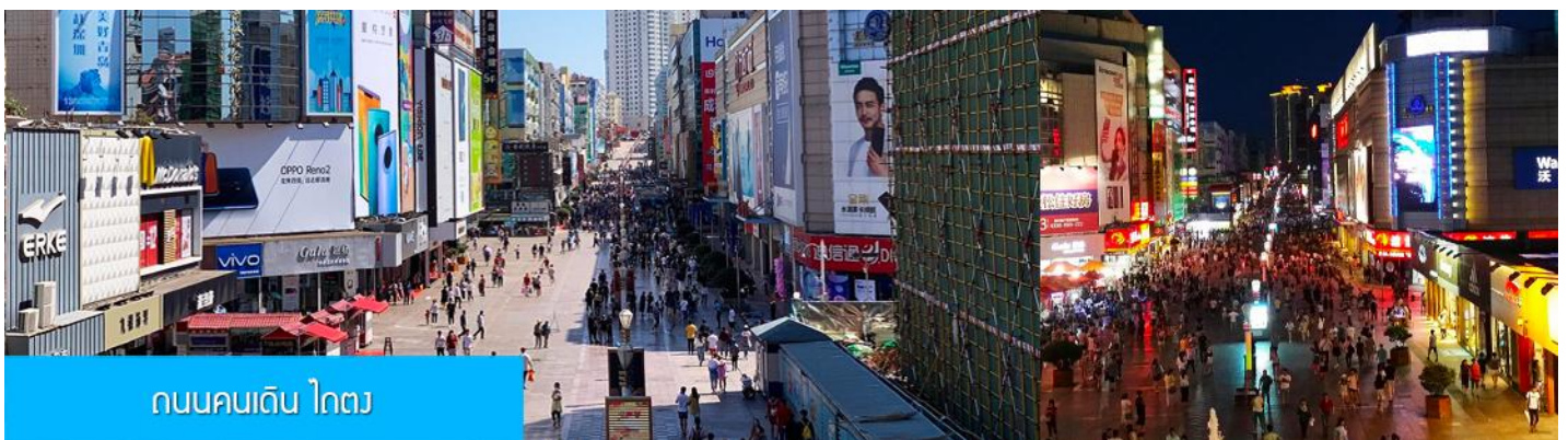
ถนนคนเดิน ไถตง

จากนั้นนำท่านเที่ยวชม โรงเบียร์ชิงเต่า 青岛啤酒博物馆 พิพิธภัณฑ์เบียร์ที่ขึ้นชื่อของเมืองชิงเต่า ซึ่งเป็นเบียร์ยี่ห้อแรกที่ผลิตขึ้นในประเทศจีน ชมเบียร์ คอลเลกชันที่มียี่ห้อหลากหลายที่สุดของโลก และชมการจัดแสดงภาพและวิดิทัศน์เกี่ยวกับวิวัฒนาการของเบียร์ ขั้นตอนการผลิตและอื่น ๆ ที่เกี่ยวข้อง พร้อมชิมเบียร์ชิงเต่า ซึ่งเป็นเบียร์ที่ขายดีที่สุดในยี่ห้อหนึ่งของจีน.. (ชิมเบียร์ชิงเต่าท่านละ 1 แก้ว รับประทานอีก 1 ขวดเล็ก ตอนเดินออก)