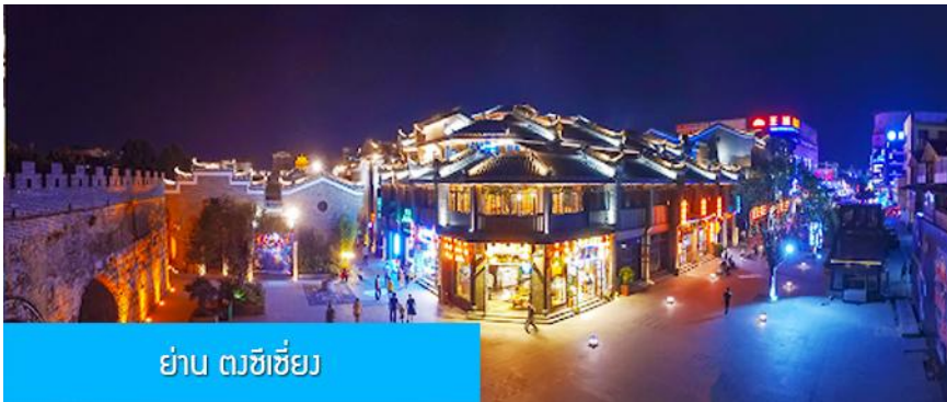
ย่าน ตงซีเซียง

จากนั้นนำท่านเที่ยวชม พิพิธภัณฑ์ดอกกุยฮวา 桂花公社 ดอกกุยฮวาเป็นดอกไม้สีเหลืองที่มีกลิ่นหอม เป็นดอกไม้ประจำเมืองของกุยหลิน จะเบ่งบานในช่วงเดือนมิถุนายน – กรกฎาคมของทุกปี ในช่วงที่ดอกกุยฮวาเบ่งบานในเมืองกุยหลินจะคลุ้งไปด้วยกลิ่นหอมจากดอกกุยฮวา ทั่วเมืองกุยหลินจะเต็มไปด้วยสีเหลืองของดอกกุยฮวา ดอกกุยฮวาสามารถนำมาแปรรูปเป็นอาหารและเครื่องดื่มได้ และได้รับความนิยมจากชาวจีนตอนใต้เป็นอย่างมาก ชมพิพิธภัณฑ์ที่ทันสมัยด้วยระบบจัดแสดงที่ทันสมัย ภายในพิพิธภัณฑ์มีความโอ่อ่า มีการสาธิตและจำหน่ายผลิตภัณฑ์ที่ทำจากดอกกุยฮวา อาทิ ขนมดอกกุยฮวา ชาที่ทำจากดอกกุยฮวา และสินค้าพื้นเมืองอื่น ๆ