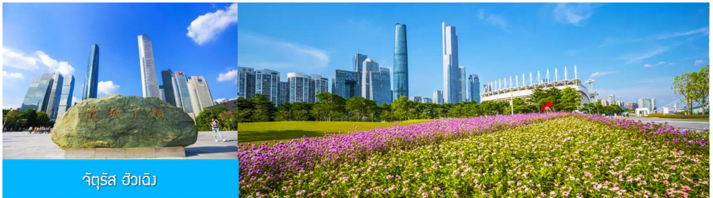
จัตุรัส ฮัวเจิง

เที่ยง รับประทานอาหารกลางวัน ณ ภัตตาคาร (เมื่อที่ 11)