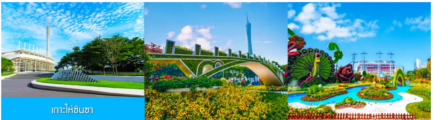
เกาะไห่ซินซา