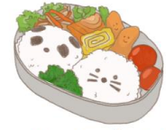
● อาหารสำหรับเด็ก ( 2-11 ปี ) *วัตถุประสงค์ขึ้นอยู่กับทาว์ราน