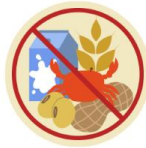
● งดอาหาร / อื่นๆโปรดระบุ