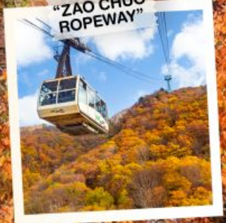
"ZAO CHUO ROPEWAY"