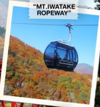
"MT. IWATAKE ROPEWAY"