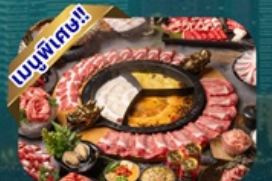
ซูฟไฟ่ชยา

พักโรงแรม 4 ดาว ★★★★★ ฟรี ประกันอุบัติเหตุ บริการอาหารท้องถิ่น