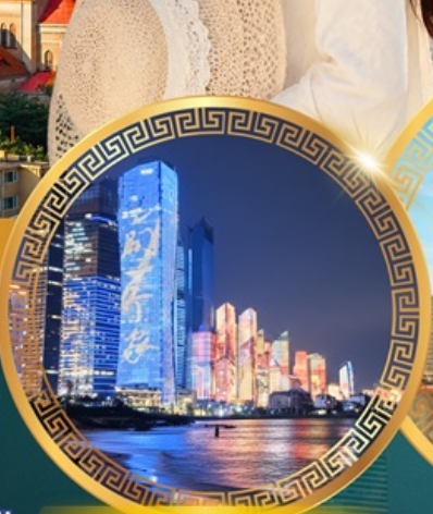
No.3 Bathing Beach

ลานจัดงานเบียร์ชิงเต่า Golden Beach ทางเดินไม้ริมทะเล ศาลเจ้าเทพทะเล ถนนคนเดินโตง พิพิธภัณฑสถานชิงเต่า สวนสาธารณะซิกแนลฮิลล์ ถนนหลงเจียงสู่ กระเช้าภูเขาไท่ผิง ยาน Da Bao island โบสถ์ st.Michael's Cathedral ถนนจงซาน ถนนคนเดินพัลลภยวน จัตุรัสเมย์ไฟร์