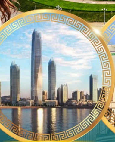
ชมวิวดาคารโฮตัน เซ็นเตอร์