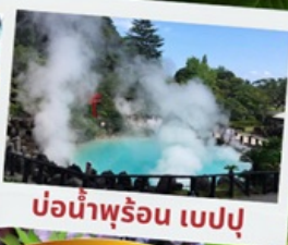
บ่อน้ำพุร้อน เบปปุ

หมู่บ้านยูฟูอินฟลอร์ริล ทะเลสาบคินริน ทะเลสาปคินริน บ่อน้ำพุร้อน อุมิจิโกกุ ท่าเรือโมจิโกะ เรโร ตลาดปลาคาราโตะ ศาลเจ้ามียาจิดาเกะ ดิวตี้ฟรี ฟุกุโอกะ เบย์ พลาซ่า ช้อปปิ้งออน มอลล์ หินคู่เมโอโตะอิวะ ชมดอกไม้ไฮเดรนเยีย รอบน้ำตกชิราอิโตะ ช้อปปิ้งย่านเท็นจิน