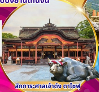
สักการะศาลเจ้าดัง ดาไซฟู