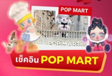
เข้คิน POP MART