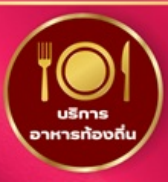
บริการอาหารท้องถิ่น