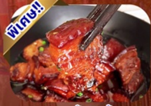
เมนูหมูสามชั้นตุ๋นน้ำแดง