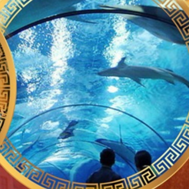
เซี่ยงไฮ้อาเซียนอะควาเรียม