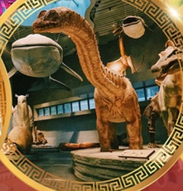
พิพิธภัณฑ์ธรรมชาติเซี่ยงไฮ้