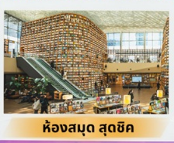
ห้องสมุด สุดชิค