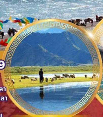
ทุ่งหญ้าทิเบตเหนือ ชางเป่ย์

ลานา พระราชวังโปตาลา วัดโจคัง ถนนแปดเหลี่ยม จุดชมวิวย่อเซ็กชากิมบาลา ธารน้ำแข็งคาโรลา ชิคาเซ่ ช่องเขาจาชัวลา ถนน108โค้ง เอเวอเรสต์เบสแคมป์ วัดทาชิลูโบ ทิวทัศน์แม่น้ำหยากู่จางปู ทุ่งหญ้าทิเบตเหนือ ช่องเขานาเคนลา ทะเลสาบนาปูซัว