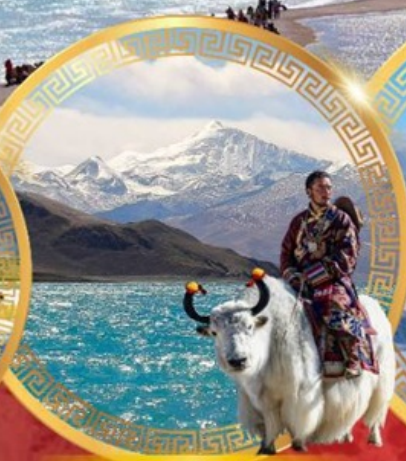
ทะเลสาบยิมดรีอก