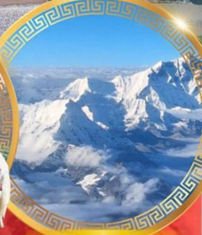
ห้าสุดยอดแห่งหิมาลิย