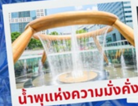
น้ำพุแห่งความมั่งคั่ง