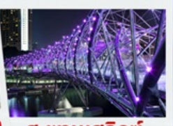
สะพานเฮลิคอปเตอร์