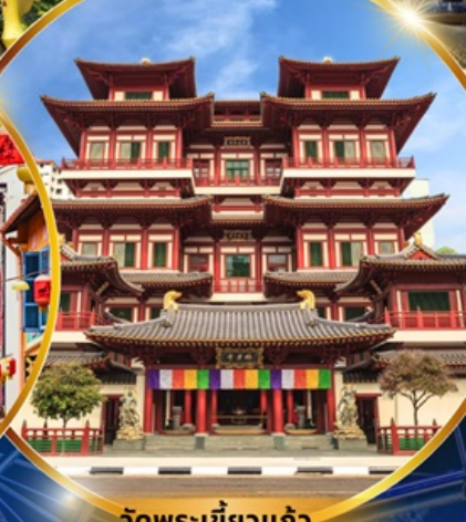
วัดพระเช็งหว่อ