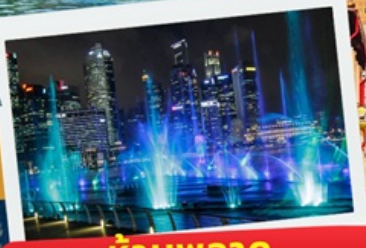
ห้ามพลาด โชว์แสง สี เสียง Spectra

Merlion Park Elizabeth Walk Marina Barrage Gardens by the Bay สะพานเฮลิคอปเตอร์ & Marina Bay Sands เที่ยว Universal Studios น้ำพุแห่งความมั่งคั่ง Jewel Changi Airport