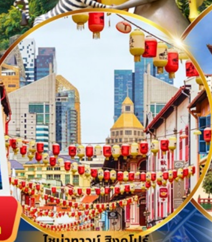
ย่านท่าวัน สิงคโปร์